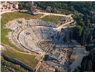
teatro Greco Siracusa.

Nel pomeriggio visita dell'isola di Ortigia e partenza per il teatro Greco.