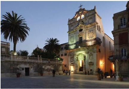
Chiesa Santa Lucia.

La chiesa è di stile e tonalità barocca sicula orientale. La tela collocata dietro all'altare Il " Seppellimento di Santa Lucia ", è realizzata da Michelangelo Merisi, meglio conosciuto come il Caravaggio , nel 1608 .