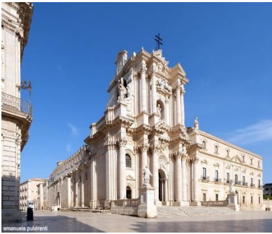
Duomo di Siracusa.

Il duomo di Siracusa , ufficialmente Cattedrale Metropolitana della Natività di Maria Santissima, sorge sulla parte elevata dell'isola di Ortigia, incorporando quello che fu il principale tempio sacro in stile dorico della polis di Syrakousai, dedicato ad Atena (Minerva) e convertito in chiesa con l'avvento del cristianesimo. Considerata la chiesa più importante della città di Siracusa, è entrata a far parte dei beni protetti dall'UNESCO in quanto patrimonio dell'umanità. Il suo stile è all'esterno principalmente barocco e rococò, mentre al suo interno alterna parti risalenti all'epoca siceliota, poiché appartenenti al tempio greco e parti risalenti all'epoca medievale, costruite dai Normanni e così lasciate fino ai giorni attuali.